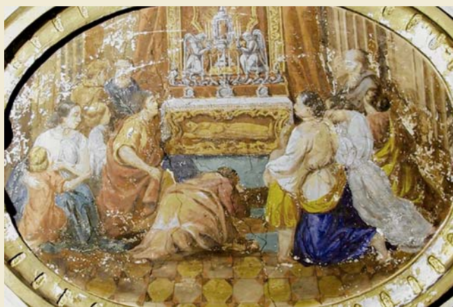
Orselina, complesso della Madonna del Sasso. Chiesa dell'Assunta. Volta della prima campata a sud, particolare di una targa dipinta dalla bottega dei Gorla (inizio Seicento).