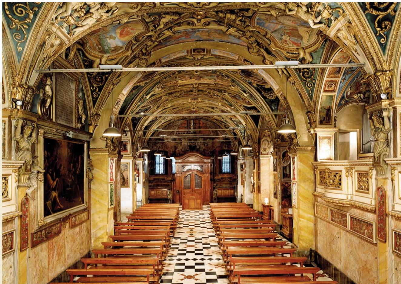
Orselina, complesso della Madonna del Sasso. Chiesa dell'Assunta. Veduta generale dell'interno. Prima del restauro.