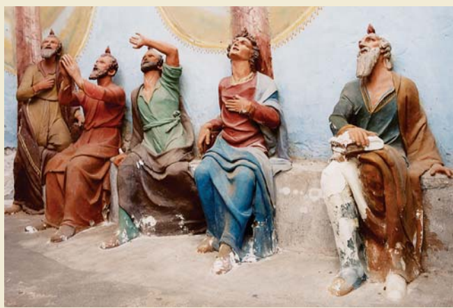
Orselina, complesso della Madonna del Sasso. Cappella della Pentecoste con le figure seicentesche in terracotta attribuite a Francesco Silva. Prima del restauro. Si notino i danni diffusi.