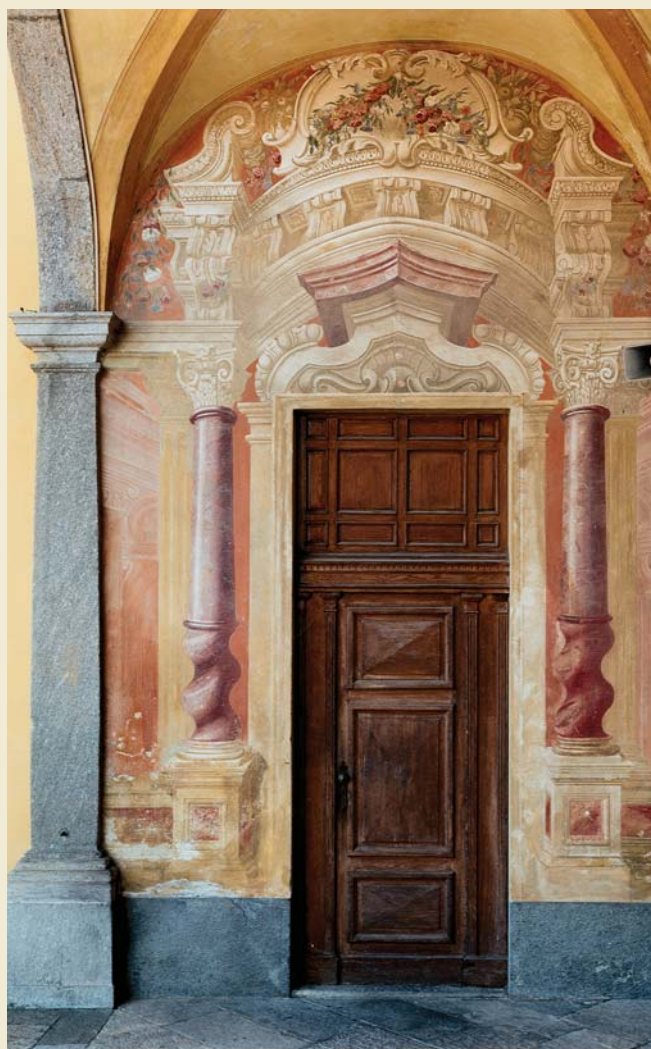
Orselina, complesso della Madonna del Sasso. Chiesa dell'Assunta. Particolare dei dipinti settecenteschi del portico di facciata. Prima del restauro.