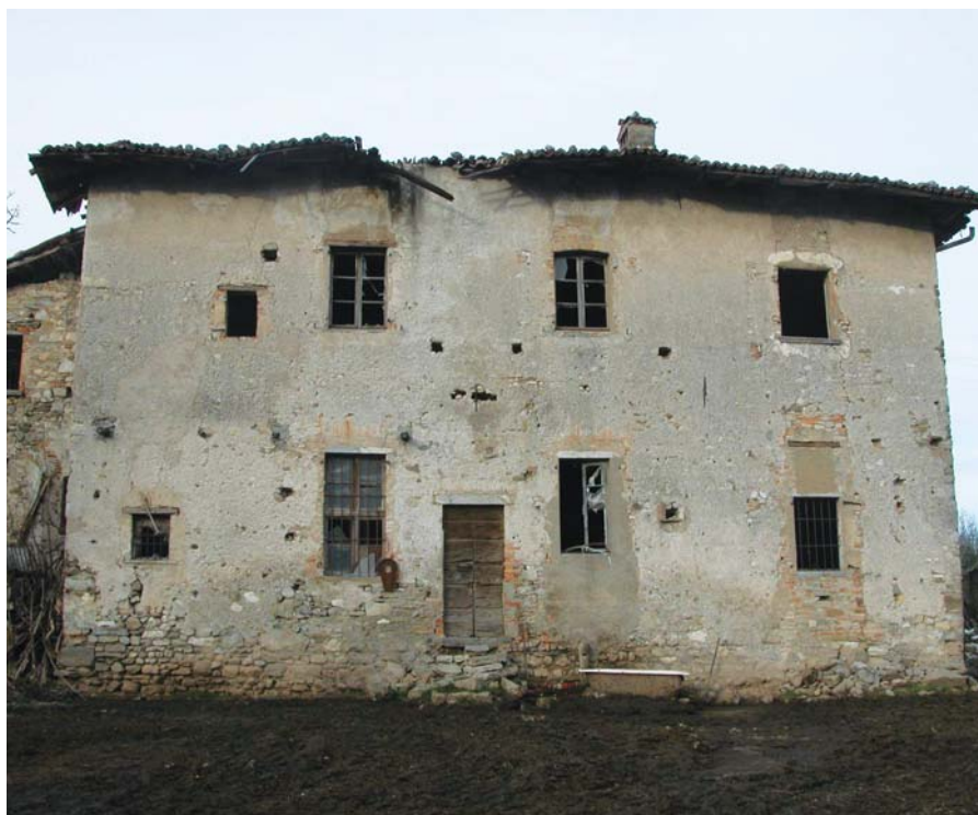
Castel San Pietro, fattoria di Vigino. L'esigenza di un intervento urgente è palese.

Inoltre vi è sempre più, all'ora attuale, l'esigenza di programmare, affrontare e risolvere al meglio i vari problemi di conservazione in modo collegiale - soprattutto per rapporto alle questioni di carattere funzionale che molti edifici civili immancabilmente